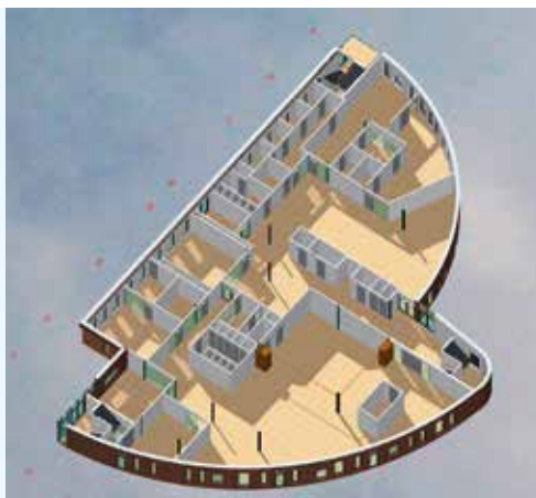
3D-PLATTEGROND BEGANE GROND.

“Het ontwikkelproces heeft een bijzonder verloop gehad. Halverwege het ontwerpproces is besloten om het gebouw op een andere locatie te situeren. Het schoolgebouw zou in de nieuwe wijk Wissinkbrink komen. Door de crisis is de ontwikkeling van de nieuwbouwwijk voorlopig uitgesteld. Een nieuwe locatie is gevonden aan de rand van de Hassinkbrink. De woningcorporatie heeft zich teruggetrokken en het OnderwijsvoorzieningsCentrum (OVC) met school, kinderopvang, gymzaal, sport en woningen is afgeslankt tot Kindercentrum. Door de locatiewisseling moest het ontwerp worden aangepast. Desondanks konden we de bestaande planning handhaven en is het gebouw in een zeer kort tijdsbestek van acht maanden gerealiseerd.”